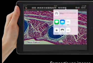
Compartir una imagen