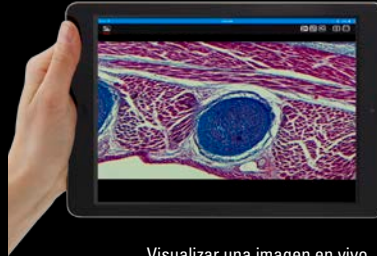
Visualizar una imagen en vivo

Con el control de pantalla táctil intuitivo, los estudiantes pueden medir, hacer anotaciones y archivar imágenes. Y lo mejor de todo: pueden compartir los resultados de trabajo con unos pocos clicks.